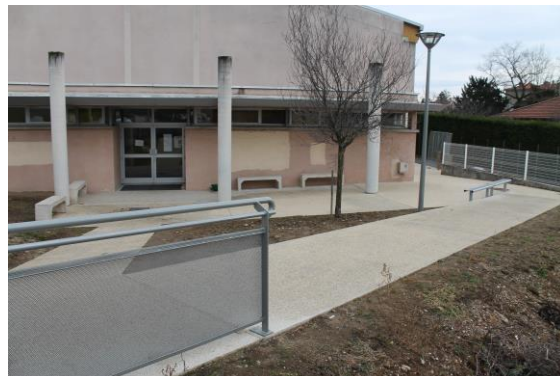
Travaux accessibilité handicapés - Septembre 2016