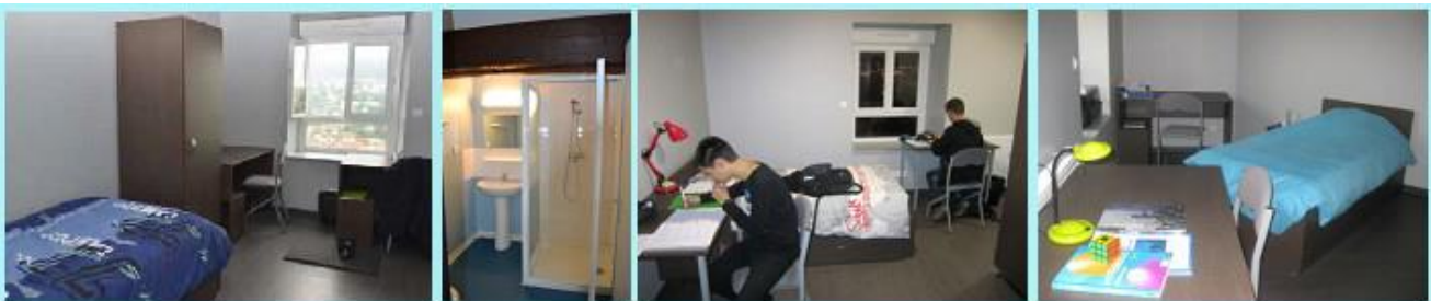
Création de 21 nouvelles chambres, de 2 voire 3 internes, supplémentaires équipées de sanitaires et douches - Septembre 2013 -