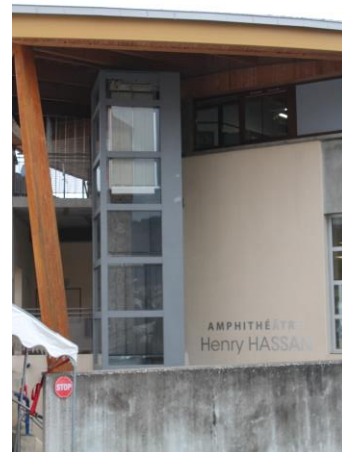
Ascenseur Bât. IP2 et administratif accessibilité handicapés - Septembre 2016